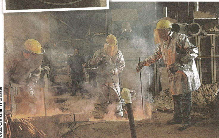
In Passau werden die Glocken gegossen (Bild oben ein Modell)