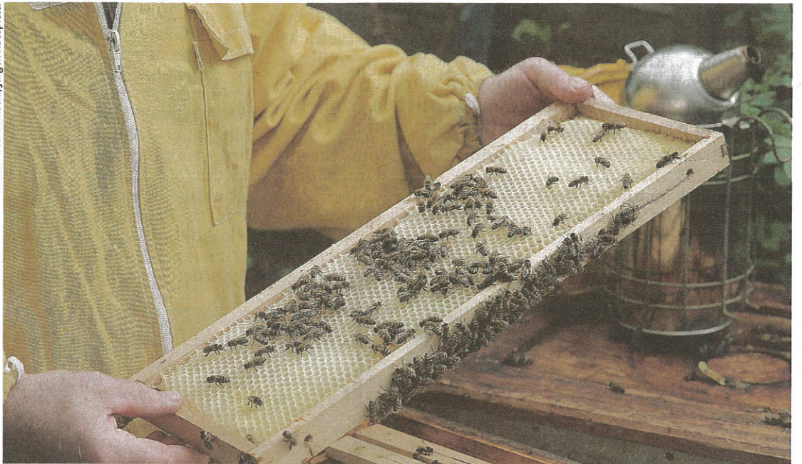
Die Bienenhaltung soll gelockert werden: Nur in Reinzuchtgebieten muss es die Carnica sein

wir beispielsweise auch Blühstreifen für die nützlichen Insekten anlegen.“ Als erster offizieller Schritt wird im April der neue Verein „Carnica-Schutz Palten-Liesingtal“ gegründet, Land und EU beteiligen sich an dem Forschungsprojekt.